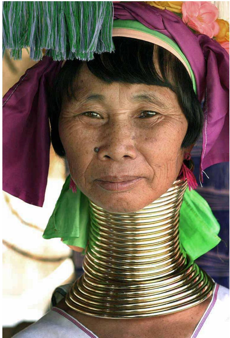
Figuur 2: Een vrouw uit Thailand met een groot aantal ringen om haar nek. Made by Sandstein.

Het overgrote deel van de werknemers (zo'n 90%) is vrouw. Zij krijgen dezelfde verantwoordelijkheden en hetzelfde loon als de mannen.