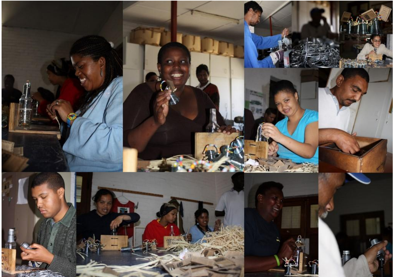
Figuur 3: De mensen van de Cape Mental Health Society aan het werk

Voor Ukuva iAfrica is het lastig om genoeg producten te verkopen. De markt voor kruidenmolens en sauzen is een niche-markt en daarom erg klein. Het is makkelijker om te werken met meer diverse producten die een grotere afzetmarkt hebben. Daarom heeft Ukuva dit jaar o.a. een aantal wijnen gelanceerd. In de toekomst zullen er meer nieuwe productlijnen bijkomen.